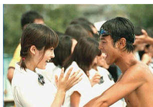
映画『ウォーターボーイズ』 （矢口史靖監督）